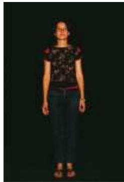
Éclairage de face avec un angle au-delà de 60^\circ

La face est employée dans des intensités suffisantes « pour voir » mais elle n'est pas l'unique direction de visibilité des comédiens.