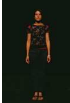
Éclairage de face avec un angle de 45^\circ

Une face trop basse ou trop forte peut altérer une image générale car elle a tendance à aplatir les visages et les décors. Il convient de se rapprocher le plus possible d'un angle de 45^\circ pour son implantation.